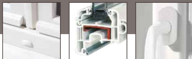
Qualité et finition dans les moindres détails